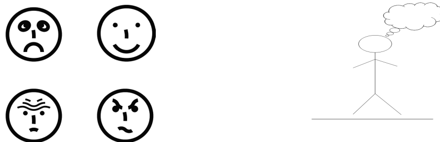
Fig.8- Stimoli visivi usati da Bruce e coll. (2010)

L'ultimo punto rappresenta una problematica cruciale nelle persone con RM in quanto possono avere difficoltà sia a collegare un effetto ad un comportamento antecedente sia ad effettuare l'analisi dei costi e benefici di una certa condotta.